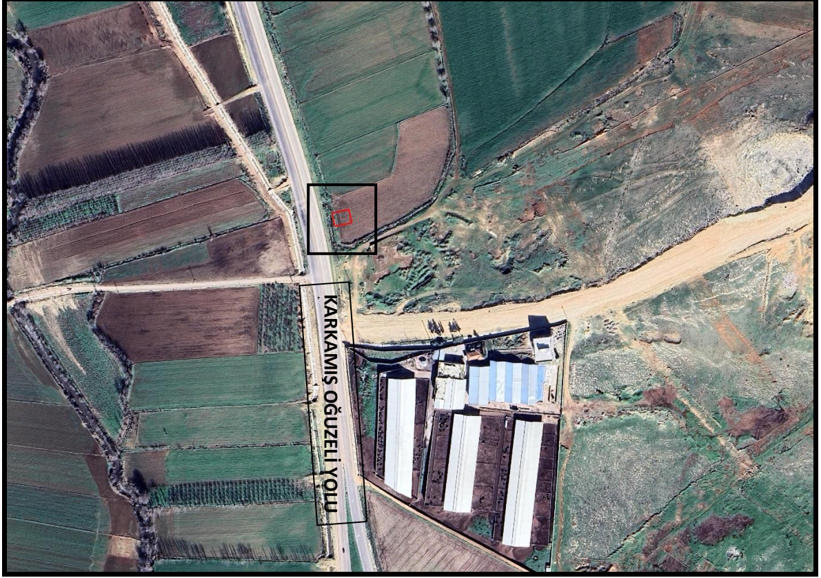
Şekil 1: Planlama Alanı Konumu

Gaziantep ili, Oğuzeli İlçesi, Kurtuluş Mahallesi sınırları içerisinde bulunan planlama alanı, Karkamış Oğuzeli Yolunun doğusunda yer almaktadır.