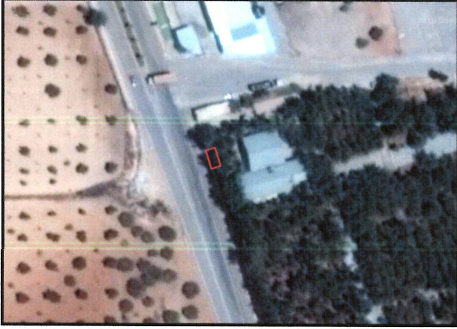
Şekil 1: Uydu görüntüsü

Plan değişikliğine konu alan, Oğuzeli ilçe merkezinin yaklaşık 1.5 km. güneyinde Kurtuluş Mahallesi'nde, Oğuzeli Karkamış yolu doğusunda yer almaktadır.