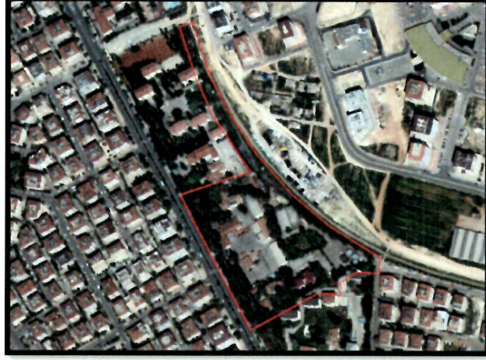
Resim 1: Uydu Görüntüsü

Şehitkamil ilçesi, Budak mahallesinde bulunan planlama alanı Maraşal Fevzi Çakmak bulvarının doğusunda, Hasırcı Sami Bey sokağının batısında, kent merkezinin yaklaşık 3 km kuzeybatısında yer almaktadır.