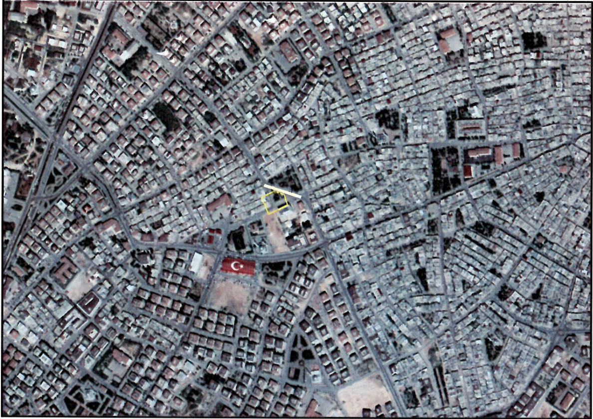
Şekil 1: Proje Alanı Kent İçerisindeki Konumu

1/5000 ölçekli nazım imar plan değişikliğine konu alan; ilçemiz Deniz Mahallesi sınırları içerisinde, Yavuz Sultan Selim caddesinin güneyinde ve M. Oğuz Göğüş caddesinin kuzeyinde yer almaktadır.